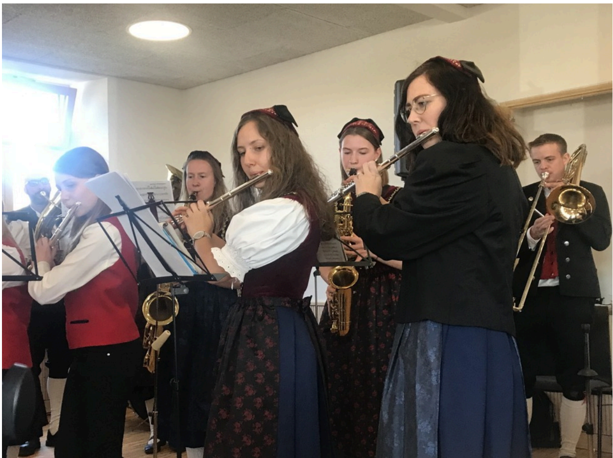
Die Einweihung des neuen Alten Schulhauses in Altenschwand mit der Trachtenkapelle Altenschwand

Gedrängte Fülle machte sich in den neu gestalteten Räumen breit, als Pfarrer Stahlberger das Glöckchen auf dem Dach des Schulhauses zur Eucharistiefeyer läuten ließ und als Erstes das Kreuz am Eingang segnete. Anstelle der Lesung fasste Architektin Katja Knaus kurz die Geschichte des Hauses von den Anfängen um 1820, dem ersten großen Erweiterungsbau um 1880, der Abänderung des Anbaus 1902 bis zur Renovierung 1971 und zur Umnutzung vom Schul- und Rathaus zum Vereinsheim durch die Eingemeindung 1973 zusammen und führte auch die erste Spendenaktion an, die 1950 eben diesem Glöckchen gegolten hatte.